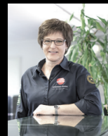
Madlen Meister Service